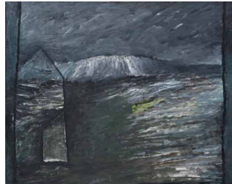
Nawojowa 30 XII 90, 1991-1995, olej na płótnie, 80 x 100 cm

Nałęczowski Ośrodek Kultury ul. Lipowa 6, Nałęczów nok@naleczow, www.noknaleczow.pl