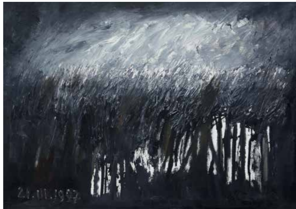
Krajobraz – pamięci Michała Łyska, 1997, olej na płótnie, 70x100 cm